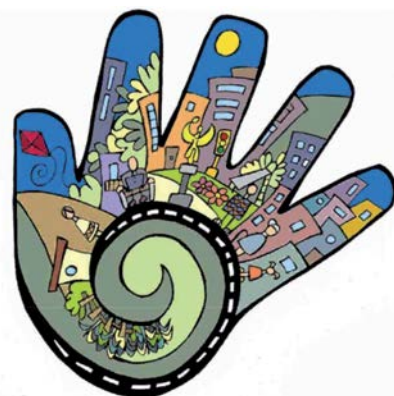
For our right to the city

3. En definitiva, el dret a la ciutat dona articulació filosòfica a una inquietud i empodera les persones, però és també un possible mecanisme tècnic-jurídic de defensa de drets, en la recerca, finalment, d'allò que el geògraf Edward Soja ha anomenat, en el títol d'un dels seus llibres, la Justícia Espacial.